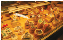
参观 Gruyère 芝士厂