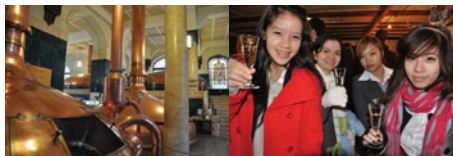
参观 la malson Mauler 酒厂

读万卷书，不如行万里路，瑞士学校得知实践的重要性，经常组织学生参观瑞士著名的酒厂、芝士厂、雪茄制造厂等，让学生更好地储备各种专业鉴赏知识和技能，开拓行业视野。